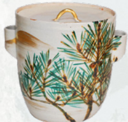
水指 若松 九代 半七造 (吉田宗洋氏) 全期展示