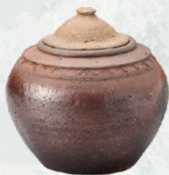
水指 南蛮 (熊倉功夫館長) 全期展示