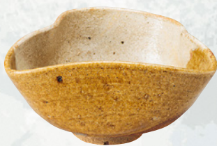
茶碗 古高取 (ふじのくに茶の都ミュージアム) II III期展示