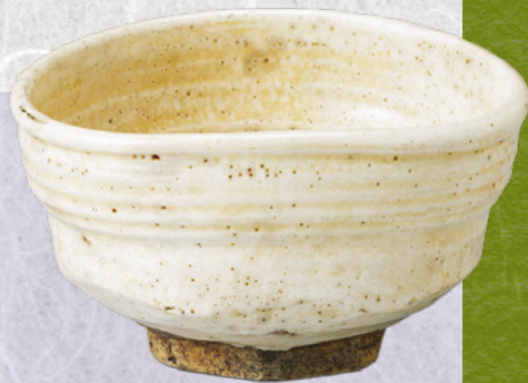
茶碗 御所丸 (大谷宗玄氏) ■ 全期展示