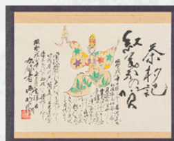
茶杓記 紅葉の賀 西山松之助筆 (鈴木宗壽氏) I期展示