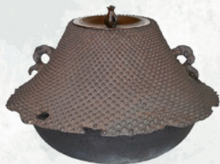
釜 霰 富士山形 浄中極 道爺造 (青島宗智氏) 全期展示