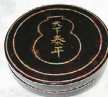
香合 青貝 天下泰平 (大谷宗玄氏) I期展示