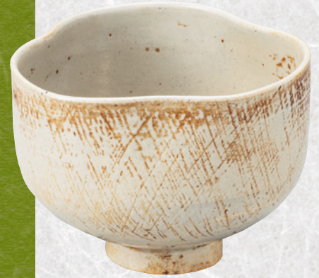
茶碗 金海 銘 住吉 (鈴木宗壽氏) ■ III期展示