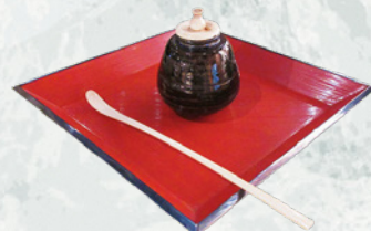
茶入 唐物 茄子 銘 独楽 茶杓 利休形 象牙 (大谷宗玄氏) IIIIV期展示