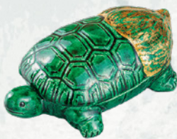
香合 亀 吉向蕃高造 (熊倉功夫館長) 全期展示