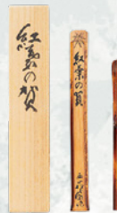
茶杓 銘 紅葉の賀 西山松之助作 (鈴木宗壽氏) I期展示