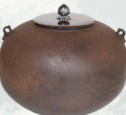
釜 宝珠 宝くし 與高造 (吉田宗洋氏) 全期展示