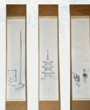
三幅対 壬生狂言桶取 八坂塔之図 大佛柱旅人 中島来章筆 (青島宗智氏) IV期展示