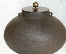
釜 靑紐 浄長極 浄味造 (青島宗智氏) 全期展示

ふじのくに茶の都ミュージアムでは、平成30年の開館以来、小堀遠州の茶室を復元した「縦目楼」を会場に茶の都特別茶会を開催しています。茶の都特別茶会は、熊倉功夫館長と静岡県内の茶人が席主をつとめ、濃茶席、薄茶席、点心席で皆さまをもてなすものです。