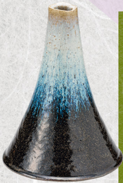
花入 朝鮮唐津 銘 富嶽 徳澤守俊造 (熊倉功夫館長) ■ 全期展示