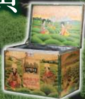
輸出用茶箱 SYMNS 井手暢子氏所蔵