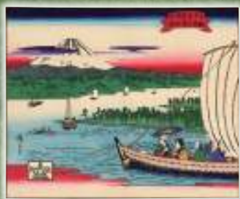
茶箱絵 大日本名所之内 駿河三保之松原(写真)