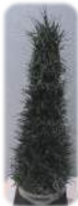
再現された天下一品茶