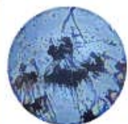
お茶成分の結晶 カテキン