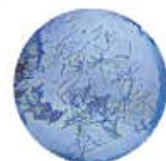
お茶成分の結晶 カフェイン

8月21日(水) ☆子ども和菓子作り教室 県民の日の記念イベント ☆ 時間: ①10:00~11:00 ②11:00~12:00 ③13:30~14:30